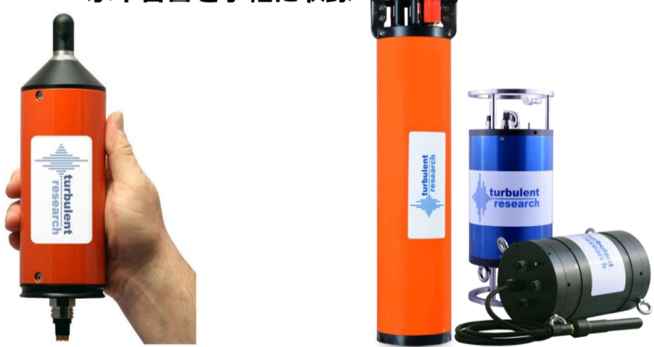
シングルチャンネル PORPOSE (標準耐圧 500m)