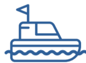
Lifeboat and Fast Rescue Craft Handling and Recovery