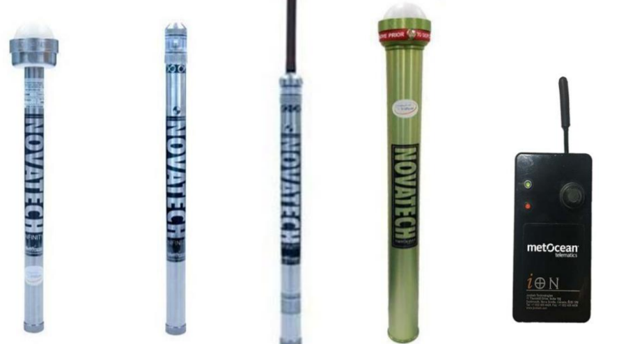
イリジウムビーコン ラジオビーコン イリジウム送信機 LEDフラッシャー 海表面用イリジウムビーコン