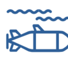
AUV Handling and Recover