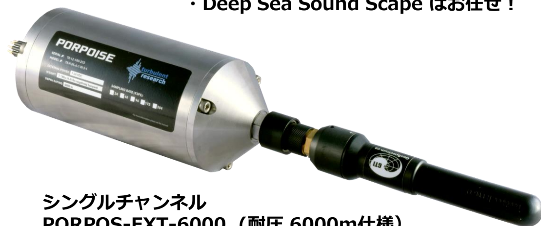
シングルチャンネル PORPOS-EXT-6000 (耐圧 6000m仕様)