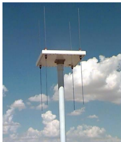
Model : FA-1248B1 アドコック式シングル チャンネルアンテナ