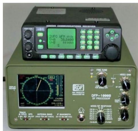
Model : DFR-1000B 方位角プロセッサ ディスプレイ/レシーバー