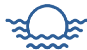
Buoys and Moorings